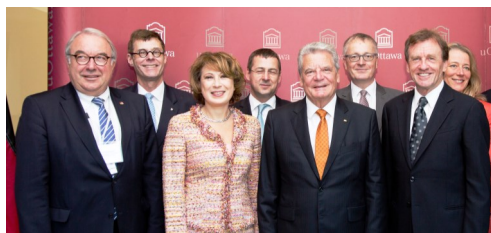
Visite du Président Gauck